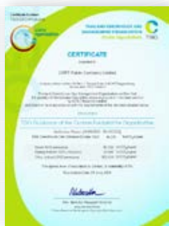
เอกสารการขึ้นทะเบียน Carbon Footprint for Organization ของบริษัท จีเอฟพีที จำกัด (มหาชน) ประจำปี 2566